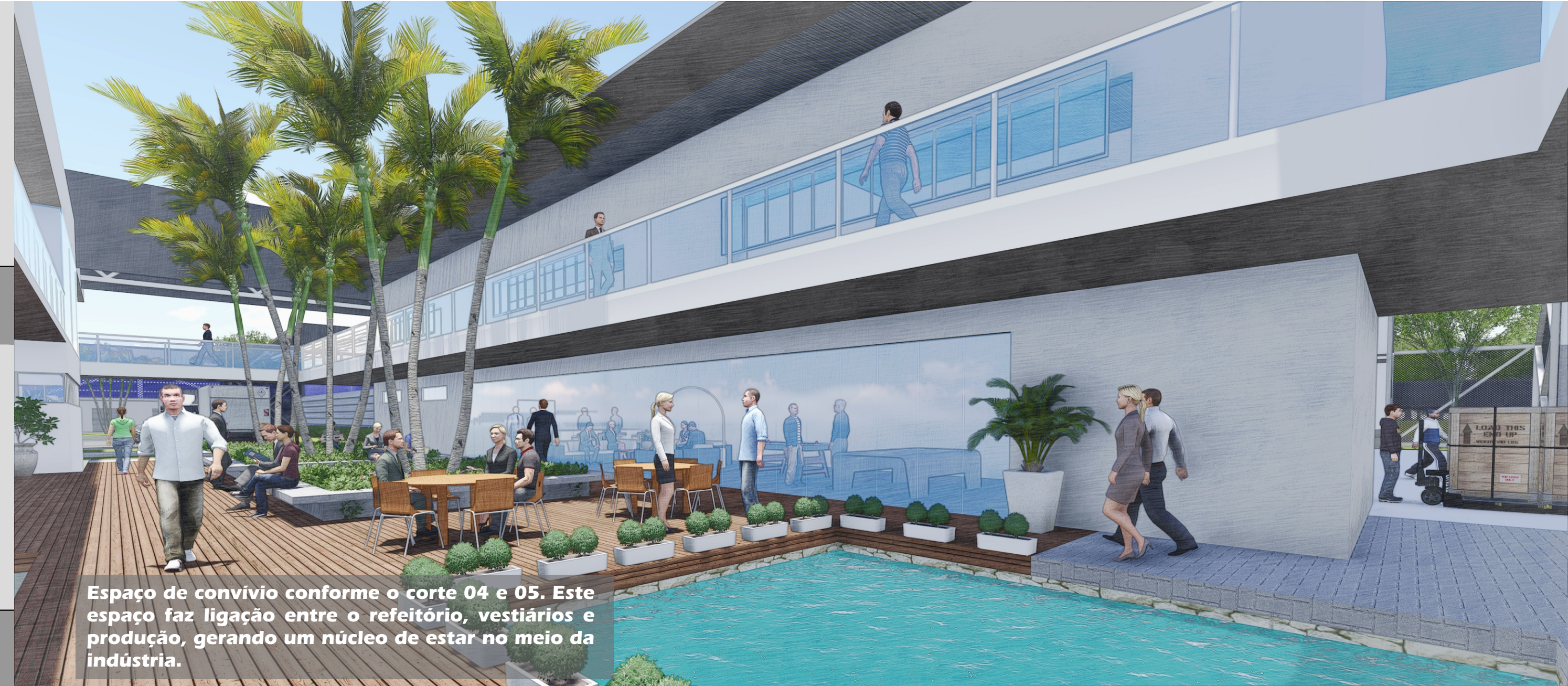
Espaço de convívio conforme o corte 04 e 05. Este espaço faz ligação entre o refeitório, vestiários e produção, gerando um núcleo de estar no meio da indústria.