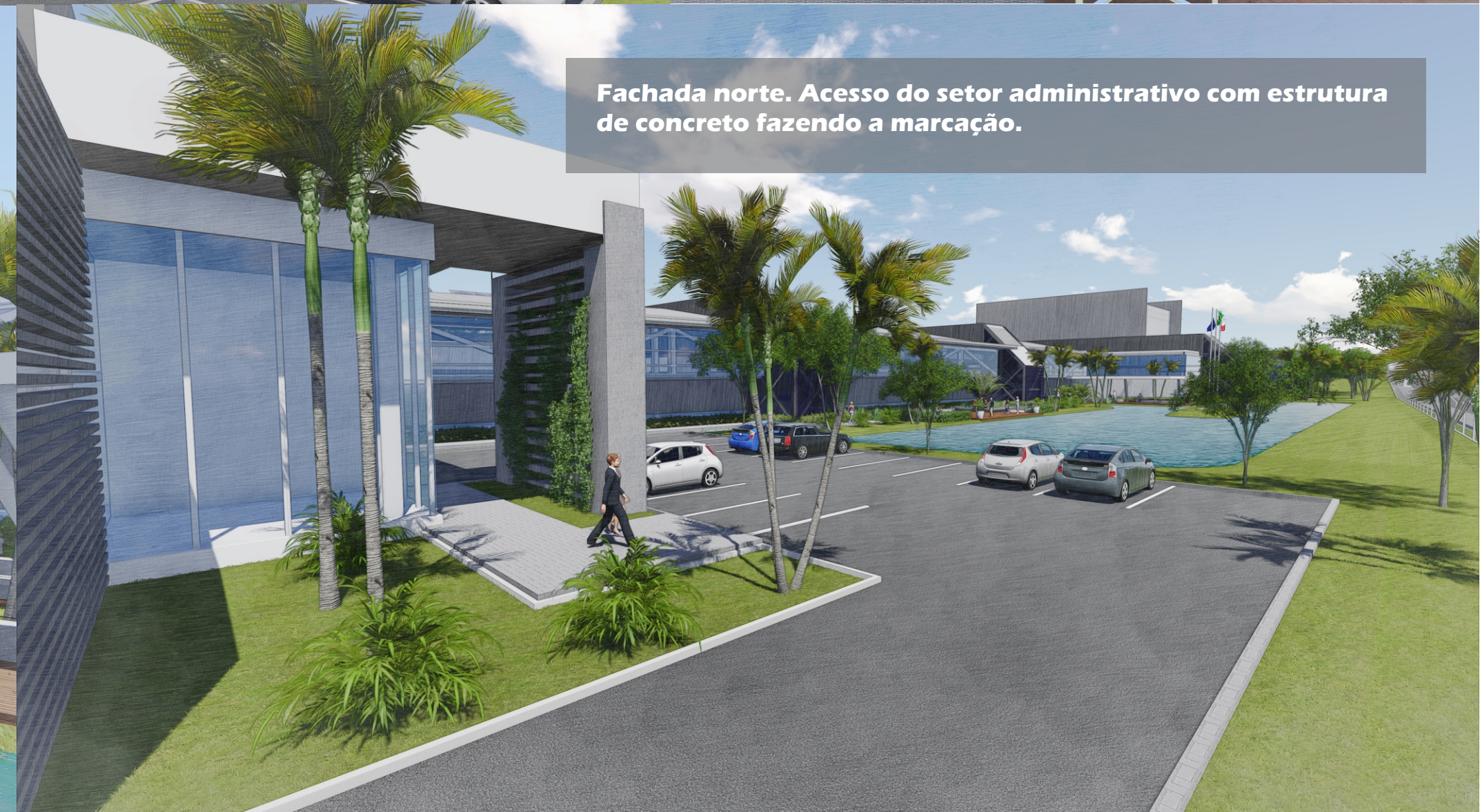
Fachada norte. Acesso do setor administrativo com estrutura de concreto fazendo a marcação.