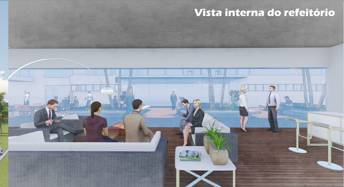
Vista interna do refeitório