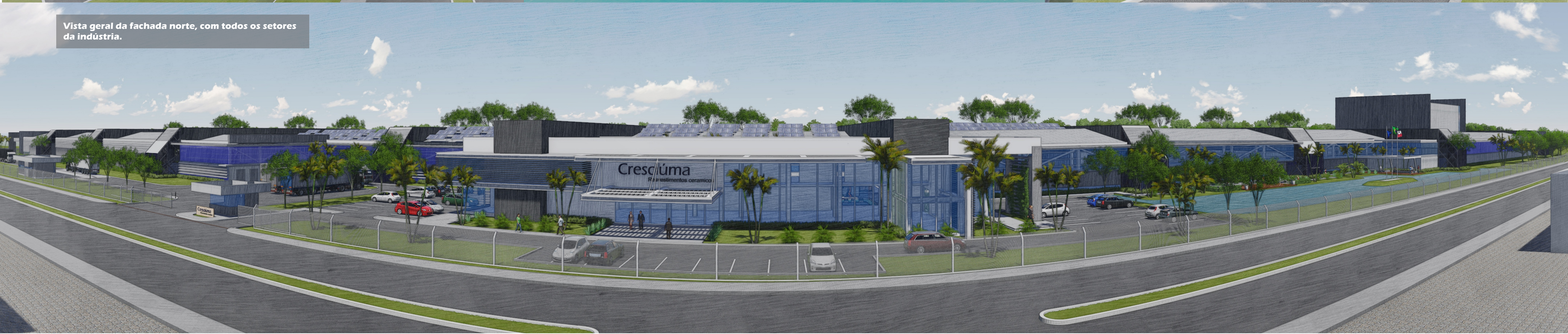
Vista geral da fachada norte, com todos os setores da indústria.