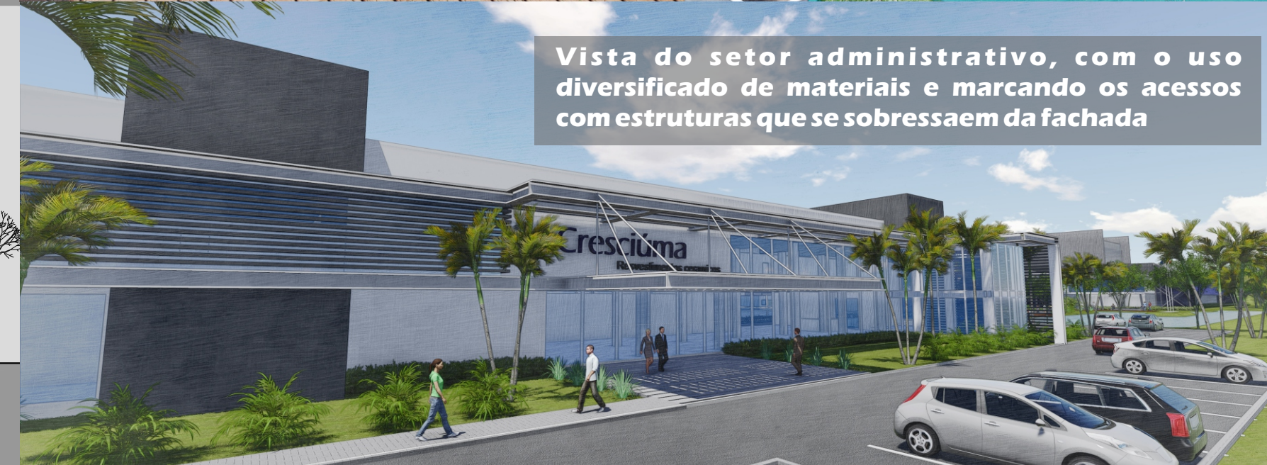
Vista do setor administrativo, com o uso diversificado de materiais e marcando os acessos com estruturas que se sobressaem da fachada