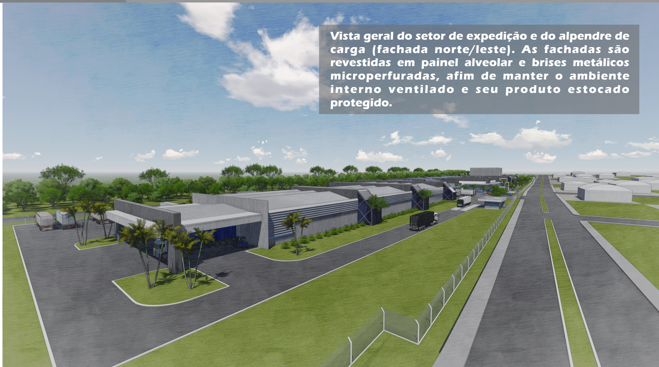
Vista geral do setor de expedição e do alpendre de carga (fachada norte/leste). As fachadas são revestidas em painel alveolar e brises metálicos microperfurados, afim de manter o ambiente interno ventilado e seu produto estocado protegido.