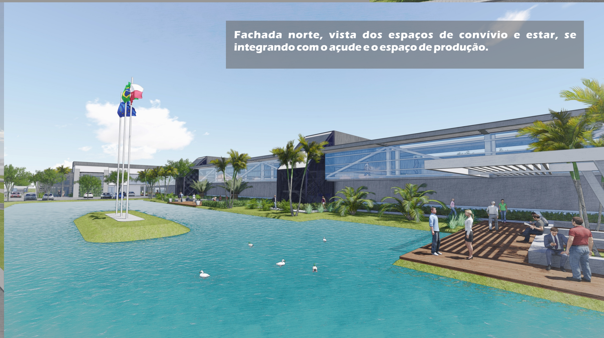
Fachada norte, vista dos espaços de convívio e estar, se integrando com o açude e o espaço de produção.